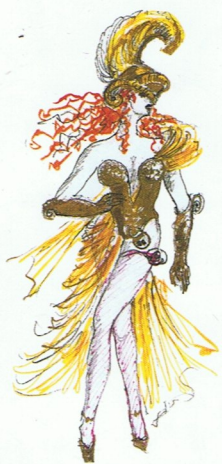
ORPHEUS in der Unterwelt