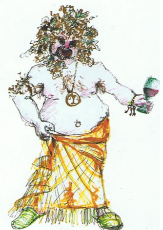
ORPHEUS in der Unterwelt